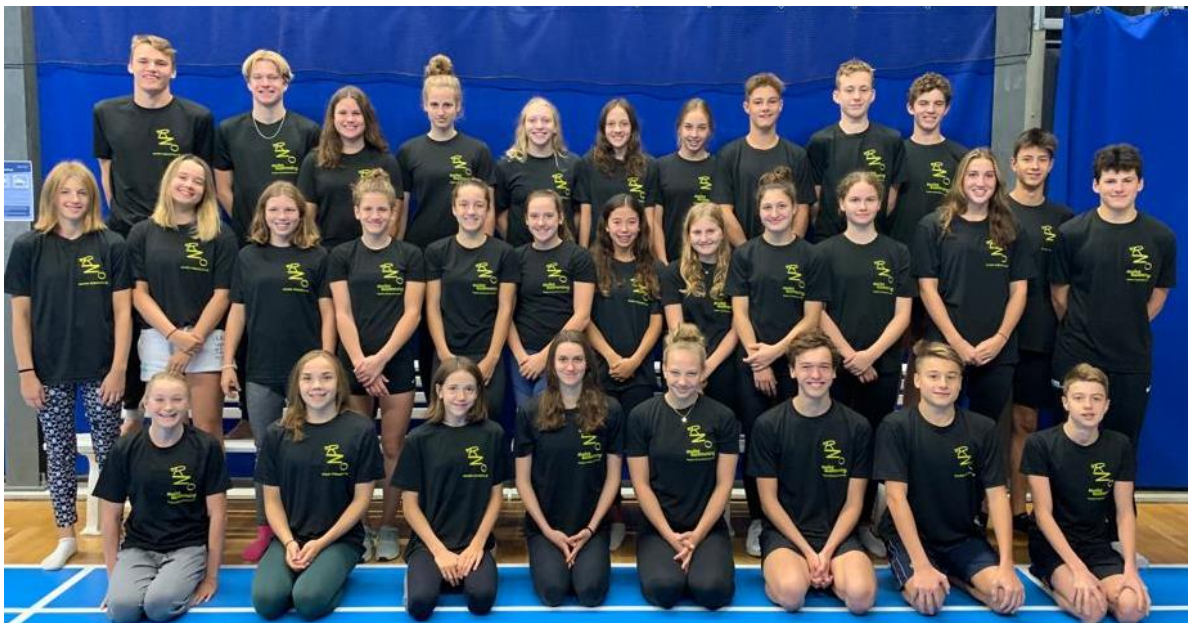
Juniorenkader in Uster (2020)