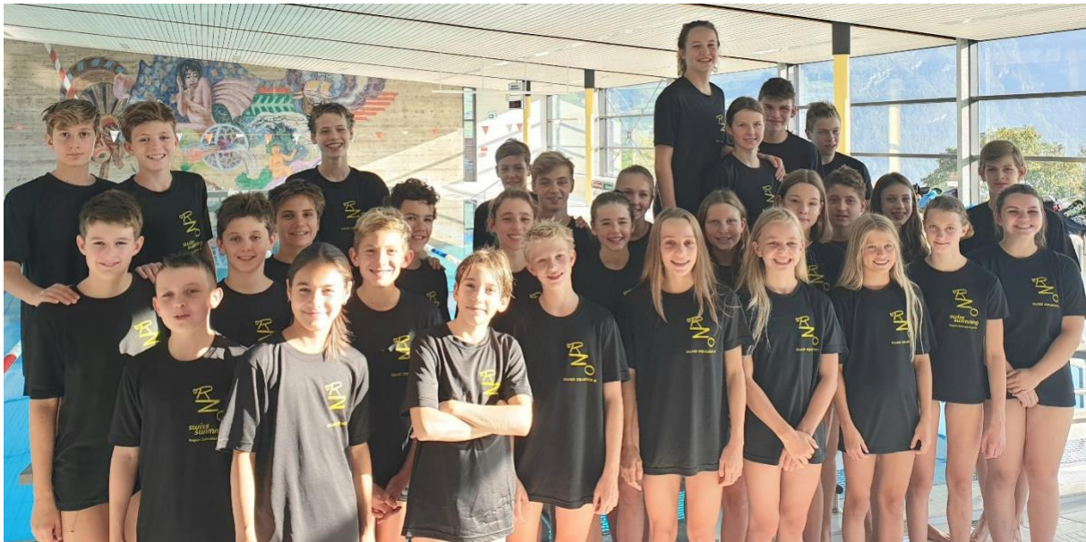
Jugendkader am Trainingsweekend in Filzbach (2020)