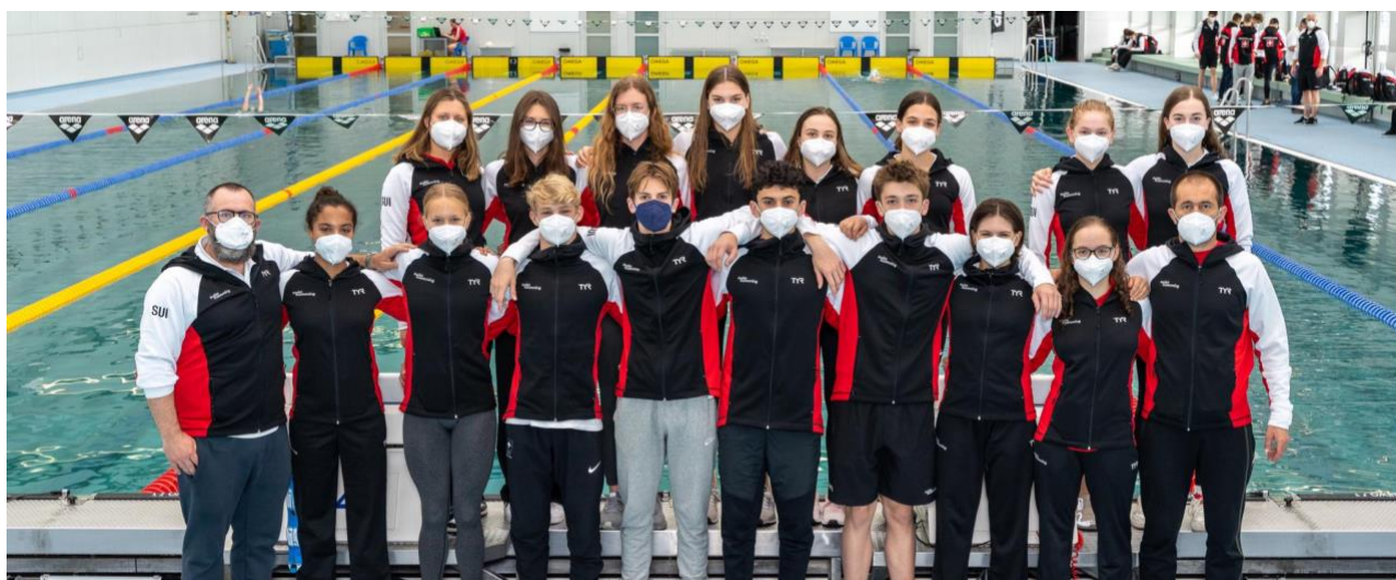
Nageurs.ses de la RSR lors de la sélection au DUAL-MEET à Vienne.

Le Collège des Entraîneurs Romands de Natation (CERN) se réunit 3 à 4 fois dans l'année pour prendre les décisions sportives nécessaires.