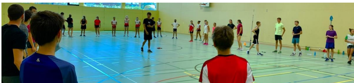
PISTE Test der RZW –am 5.9.2020

Zwei Mal pro Jahr findet eine RZW-Trainersitzung statt (September und April) um sportliche Angelegenheiten des Kaders zu besprechen und Vorschläge einzubringen. Die gute Zusammenarbeit aller Coaches, um somit die besten Ressourcen für sportliche Entwicklung der Athleten zu gewährleisten, ist der Region RZW ein grosses Anliegen.